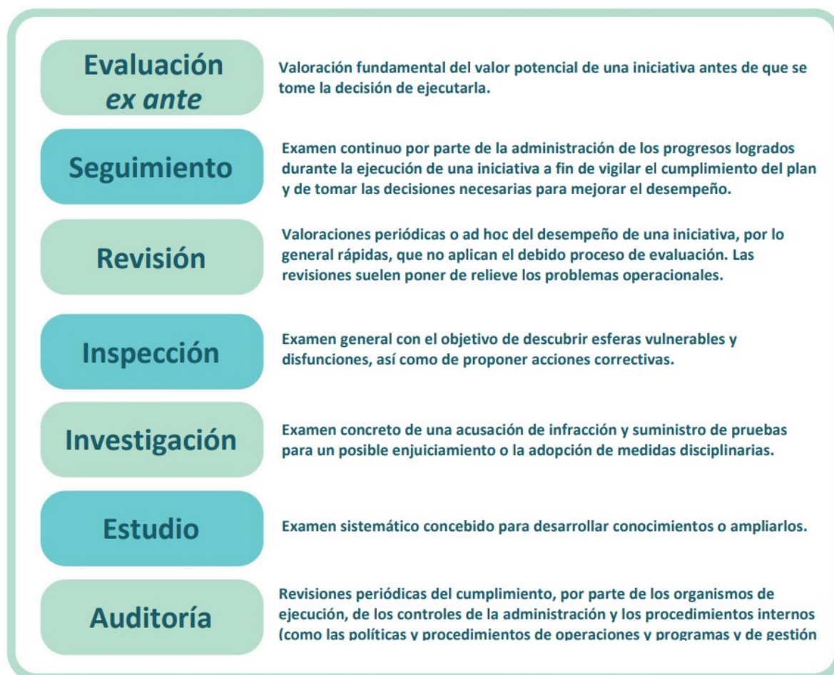
Figura 2. Ejemplos de otras funciones de supervisión, rendición de cuentas y valoración

Existe una clara diferencia entre el seguimiento y la evaluación .